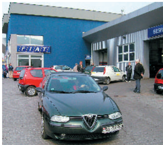
Dni otvorených dverí v servise, ktoré sa konajú 2x ročne, sa už stali tradíciou